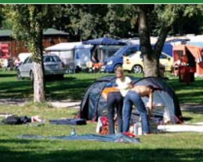
IMPRESSIONEN VOM CAMPINGPLATZ